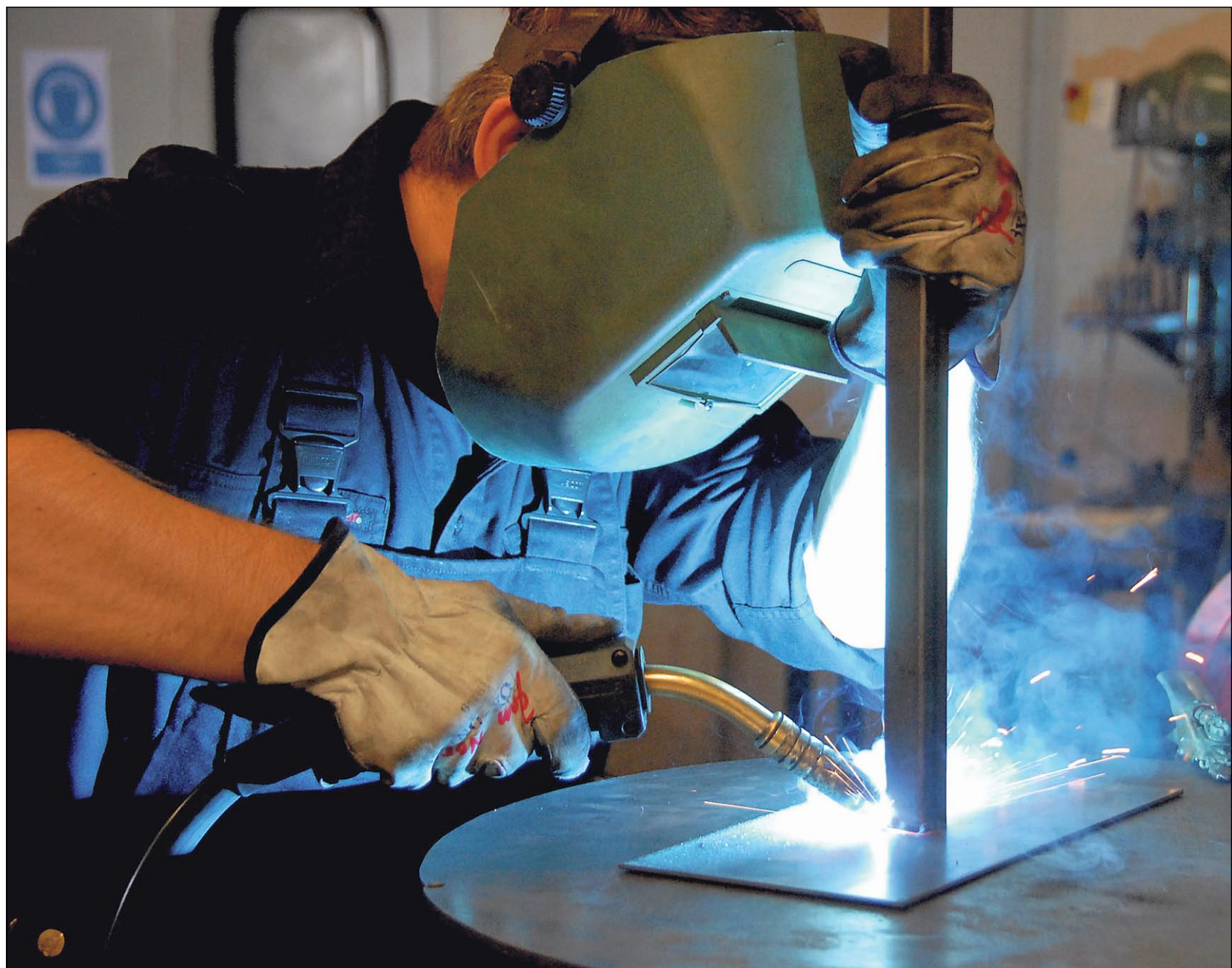
Herning Værktøjs- og Metalvarefabrik, som billedet her er fra, har sammen med Meteor Herning oprettet salgsselskabet Steelhouse A/S.